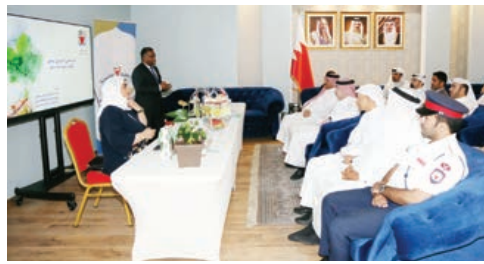
○ جانب من فعاليات المحاضرة.