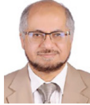
د. إبراهيم عبيد

منشطة من هذا اللقاح للحجاج الذين تم تطعيمهم قبل 5 أعوام. ويوصى الحجاج أيضاً بأخذ لقاح الإنفلونزا الموسمية لحمايتهم من بعض أنواع فيروسات الإنفلونزا الموسمية الأكثر انتشاراً في الموسم. كما يشترط على جميع الراغبين في أداء مناسك الحج استكمال الجرعات (كوفيد-19) الموصى بها من اللقاحات المعتمدة في المملكة العربية السعودية، ويوصى بالتأكد من استكمال التطعيمات الروتينية الأخرى حسب الحالة الصحية والفئة العمرية، وتؤكد اللجنة التنسيقية لأعمال بعثة الحج الطبية على ضرورة أخذ التطعيمات الخاصة بموسم الحج قبل السفر للديار المقدسة بأسبوعين على الأقل، وذلك لتأمين الحصانة المنشودة منها قبل السفر. ودعا رئيس اللجنة التنسيقية لأعمال بعثة الحج الطبية الدكتور إبراهيم فاروق عبيد حجاج بيت الله الحرام إلى قراءة الكتيب الصحي الإرشادي الخاص بالحج والعمرة الذي سيتم توزيعه في مراكز الرعاية الأولية للحجاج والاستفادة من المعلومات الصحية به، والتي تساعد على رفع